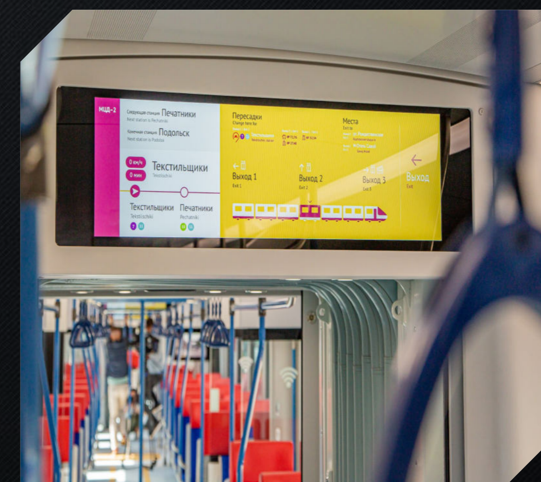
Электронные маршрутные табло