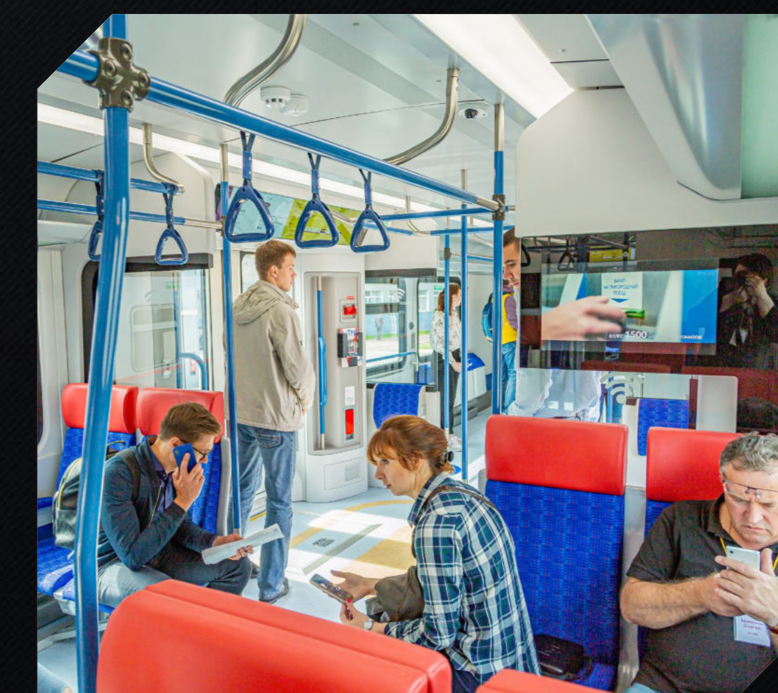
Система подсчета пассажиров